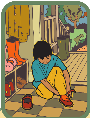
ចូរដោះស្បែកជើងចេញ កុំនាំដីចូលទៅក្នុងផ្ទះ ។