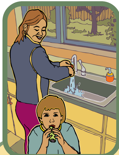
ចូរលាងប្រដាប់លេង និងក្បាលដោះក្មេងបៅ ឲ្យបានញឹកញាប់ ។

បានប្រាក់ជំនួយពីក្រសួងបរិស្ថានភូមិភាគឥសាន នៃរដ្ឋវ៉ាស៊ីនតោន ប្រគល់ជូនតាមទម្រង់ត្រូវការ ។