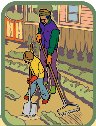
ចូរពាក់ស្រោមដៃ ពេលធ្វើការនៅទីនិង សួនច្បារ ។