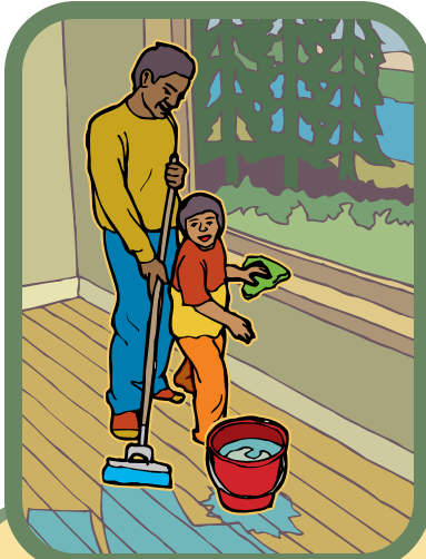
ត្រូវបោសជូលចេញ — ជ្រលក់ក្រណាត ជួតធម្មតា ។