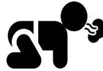
Kahirapan sa paghinga