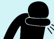
Takpan ang ubo ng siko o tisyu