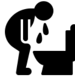
Pagsusuka pagkatapos umubo