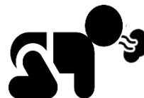
Затруднённо е дыхание