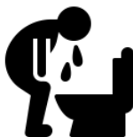
Рвота после кашля