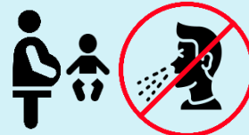
Держитесь подальше от младенцев и беременных