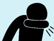
Кашляя, прикрывайтесь локтем или салфеткой