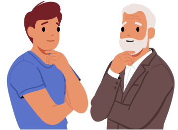
بزرگسالان ۱۹ سال به بالا