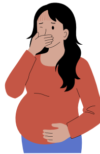
خانم‌های حامله دار