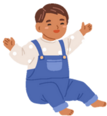
نوزادان و اطفال خردسال

واکسین‌ها، مثل هر داروی دیگر، می‌توانند عوارض جانبی داشته باشند. رایج ترین عوارض جانبی خفیف هستند و خود به خود از بین می‌روند. به نمودار و جدول زیر توجه کنید تا ببینید کدام واکسین برای شما مناسب است.