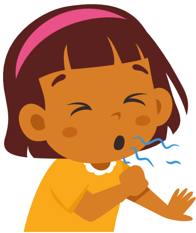
ក្អកខ្លាំងដល់ថ្នាក់ ទប់លែងបាន

ជំងឺក្អកមានន័យបណ្តាលមកពីមេរោគបាក់តេរីដែលឆ្លងពីមនុស្សម្នាក់ទៅមនុស្សម្នាក់ ទៀតតាមរយៈខ្យល់។ សញ្ញាខ្លះៗមានដូចជា៖ ក្អកខ្លាំងដល់ថ្នាក់ទប់លែងបាន ក្អក និងពិបាកដកដង្ហើម៖