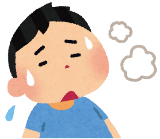
ពិបាកដកដង្ហើម