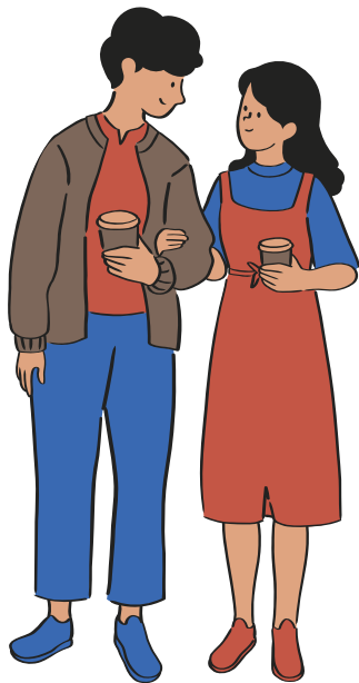
بزرگسالان ۱۹ ساله و بالاتر

افراد در تمام سنین می‌توانند واکسینه شوند تا خود و دیگران را محافظت کنند.