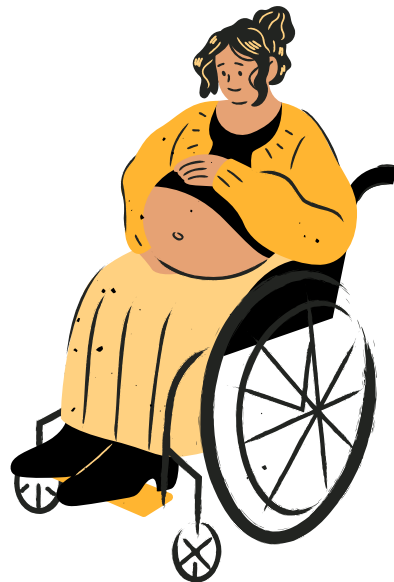
زنان حامله دار

در هر وقت برای کسانی که هرگز آن را دریافت نکرده‌اند.