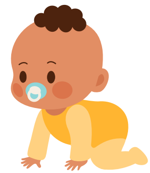
نوزادان و اطفال خردسال