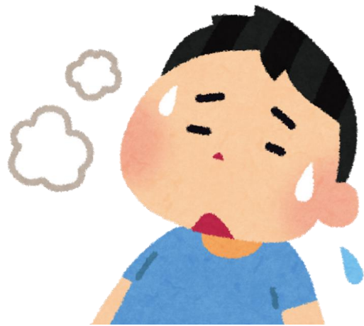
مشکل در تنفس

یا پرتوسیس نیز معروف است Pertussis سیاه سرفه که به توسط باکتری‌ها ایجاد می‌شود که از یک فرد به فرد دیگر در هوا پخش می‌شود. برخی از علائم آن شامل: