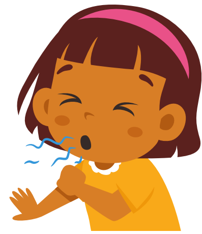
سرفه شدید و پی‌درپی