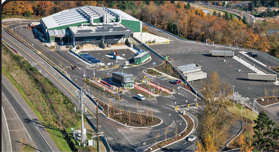
Bow Lake Recycling and Transfer Station.

金郡在 2020 年秋天召集了 25 人組成一個顧問團隊，在選址過程中為 Kirkland、Woodinville 和 Redmond 的居民、社區和業者的利益發聲。自當時起，該顧問團隊在整個選址過程中提供了許多寶貴的意見。我們歡迎民眾參加這場虛擬會議，提供意見來供團隊考量，並監督顧問團隊執行其份內工作。